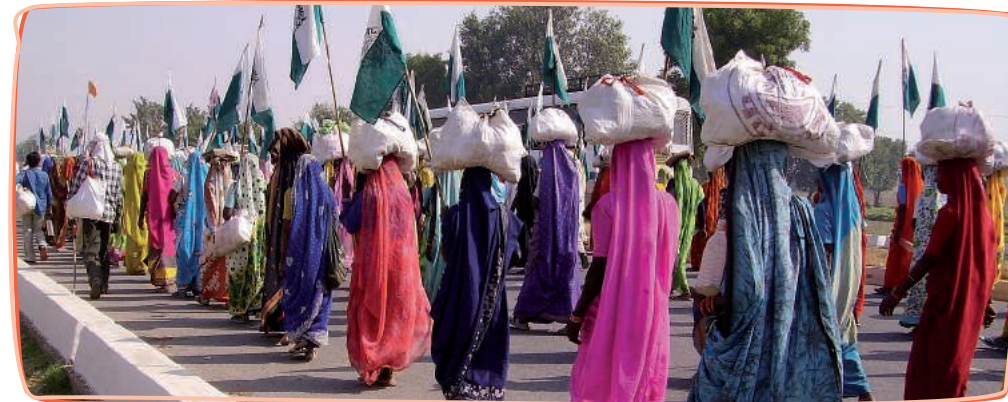
Marcheuses et marcheurs durant la marche Janadesh d'Octobre 2007 entre Gwâlior et Delhi.

J'ai été informé-e par Ekta Parishad, Peuples Solidaires / ActionAid et SOLIDARITÉ que 100 000 indien-ne-s participeront à la marche Jansatyagraha en 2012 pour réclamer leurs droits à la terre et aux ressources naturelles. Cette marche dénoncera les accaparements de terres qui les privent de telles ressources et la mauvaise mise en œuvre de la législation et des recommandations institutionnelles en faveur d'une réforme agraire. En soutien à ce mouvement, je vous demande d'assurer la mise en œuvre rapide et adaptée de telles législations, la formulation d'une réforme agraire globale comme annoncé en 2007 ainsi qu'un arrêt immédiat des conversions et accaparements de terres agricoles et de forêts.